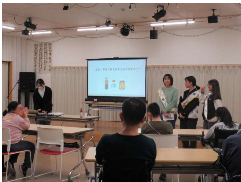
私のみらい選択(暮らし編) 2025.11.26(水) まるこ福祉会「演説」