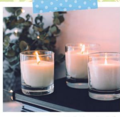
アロマキャンドルを作ったよ!