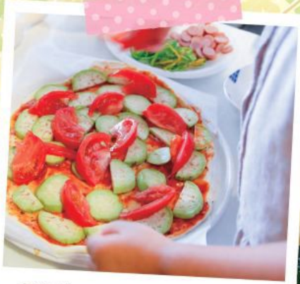
夏野菜のピザ!おいしかった~