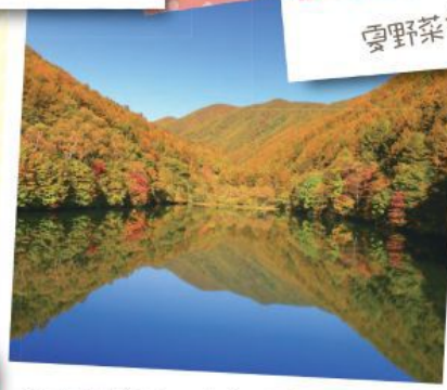
紅葉最高!! 空気もおいしい~