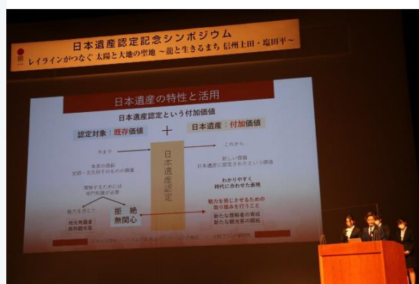
サントミュージゼでの発表会の様子の

日本遺産認定記念シンポジウム●日時 2020年12月13日(日)13時半～16時半 ●場所 サントミュージゼ大ホール